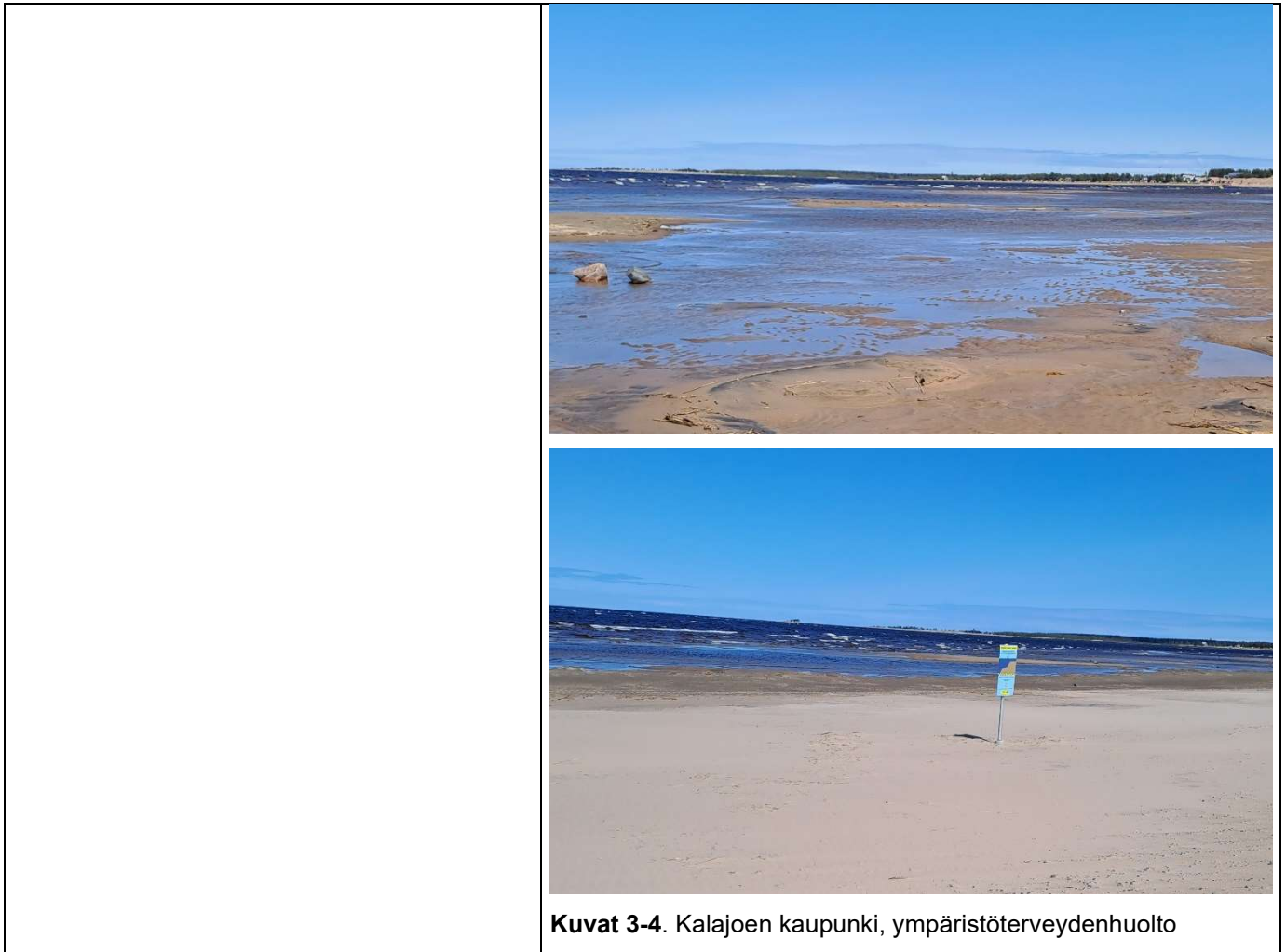
Kuvat 3-4. Kalajoen kaupunki, ympäristöterveydenhuolto