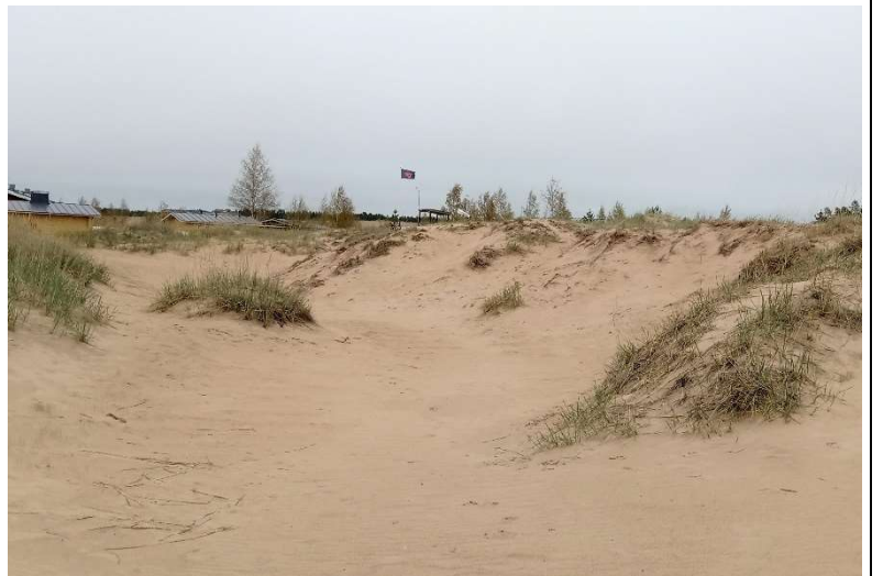
Kuvat 1 & 2. Kalajoen ympäristöterveydenhuolto